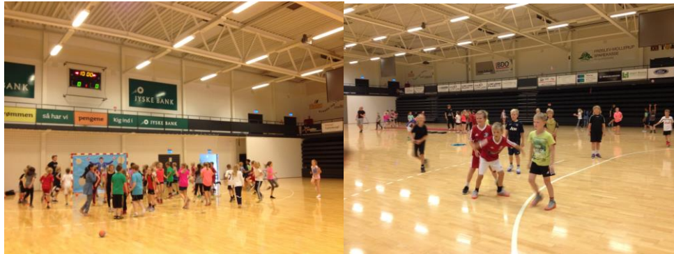
Det var en fin formiddag i Arenaen