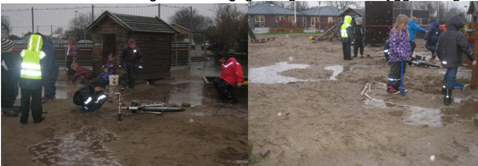
God weekend Frank

Trods en "våd torsdag" var der rigtig mange børn, der hyggede sig i de store pytter.