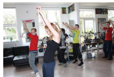
Der danses til Gangnam Style i overbygningen