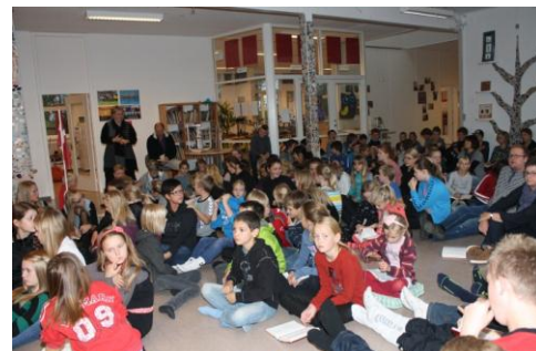
Børnene hører godt efter, mens pressegruppen fortæller dokumentarfilmen Super Size Me

Så er der godt gang i motionsugen. I denne uge gælder det bare om at komme ud og bevæge sig, og spise noget sundt mad. Hver morgen starter pressegruppen med morgensang. Mandag morgen blev der fortalt om dokumentarfilmen Super Size Me.