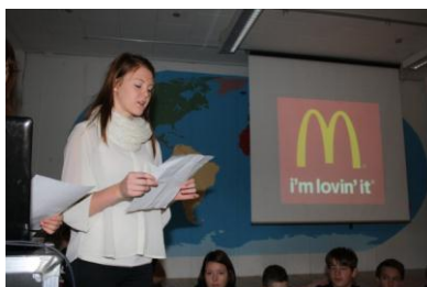
Til morgensang fortælles der om dokumentarfilmen Super Size Me