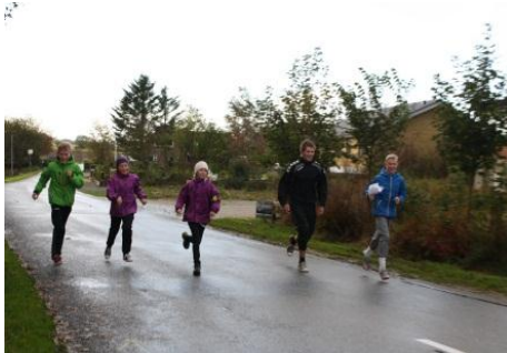
Morgendagens løbetur for mellemtrinnet