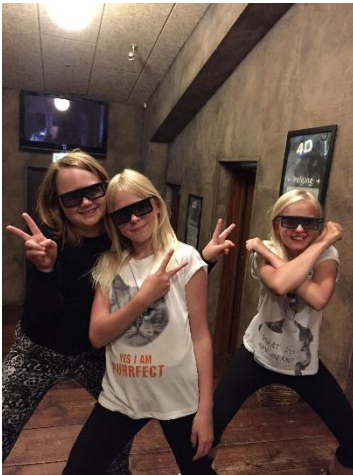
Referat af Tweens

Her er lidt billeder af vores ture i Jesperhus.